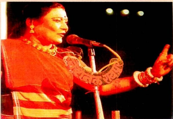
तीजन बाई (पंडवानी गायिका)