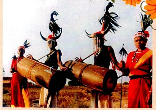
आदिवासी नृत्य (बस्तर)